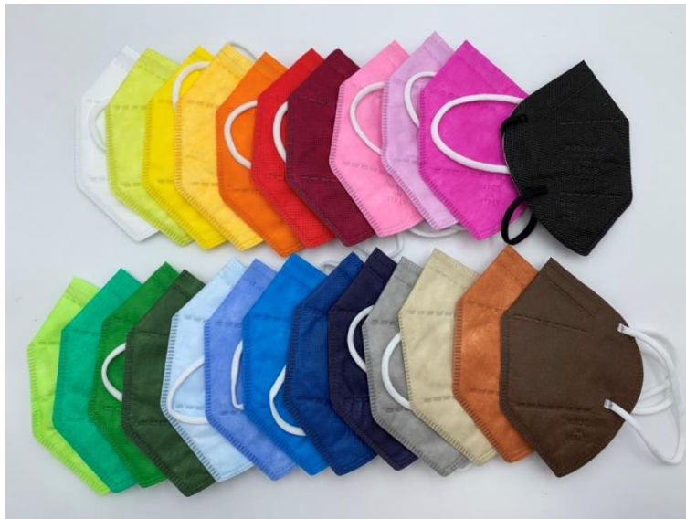
FOTO SEMIMASCHERA PHOTO OF HALF MASK

The PPE type complies with the applicable essential health and safety requirements of Regulation (EU) 2016/425.