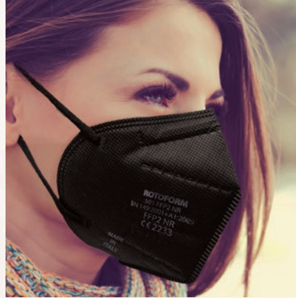
N° 4 NERO/BLACK