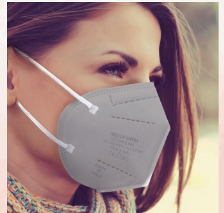
N° 15 GRIGIO/GREY

IT SEMIMASCHERA FILTRANTE EN FILTERING HALF MASK DE HALBMASKE FILTERN ES MEDIA MÀSCARA FILTRANTE FR DEMI-MASQUE FILTRANT