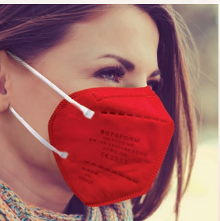
N° 10 ROSSO/RED