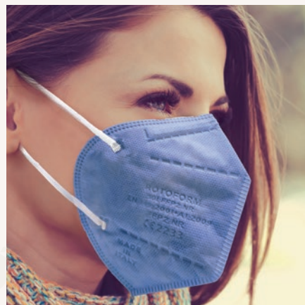
N° 37 LAVANDA/LAVENDER