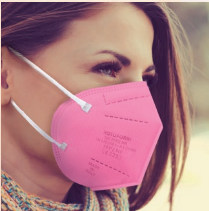
N° 50 ROSA/PINK