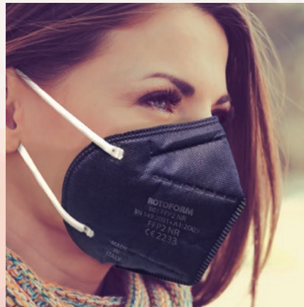
N° 5 BLU NOTTE/DARK BLUE