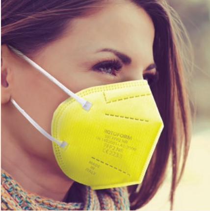
N° 7 GIALLO/YELLOW