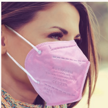
N° 19 GLICINE/WISTERIA