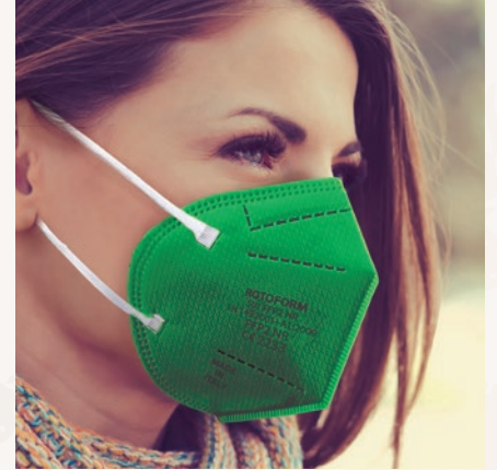
N° 9 VERDE/GREEN