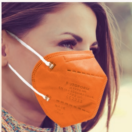
N° 44 ARANCIONE/ORANGE