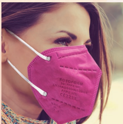
N° 47 CICLAMINO/CICLAMEN